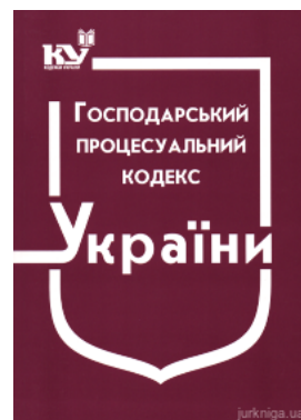
Господарський процесуальний кодекс України