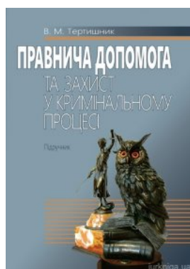
Правнича допомога та захист у кримінальному процесі