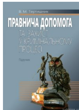
Правнича допомога та захист у кримінальному процесі