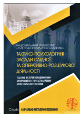
Тактико-психологічні засади слідчої та оперативно-розшукової діяльності