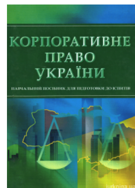
Корпоративне право України. Навчальний посібник для підготовки до іспитів