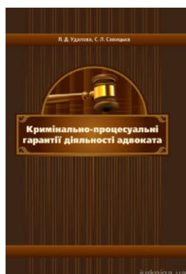
Кримінально-процесуальні гарантії діяльності адвоката. Монографія