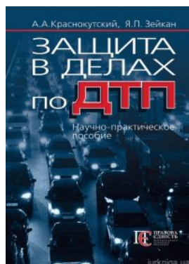
Защита в делах по ДТП. Науч.-практ. пособ