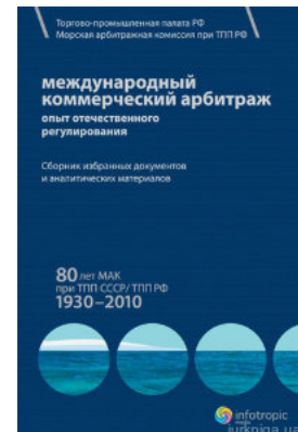
Международный коммерческий арбитраж: опыт отечественного регулирования. 80 лет МАК при ТПП СССР/ТПП РФ. 1930–2010 гг.