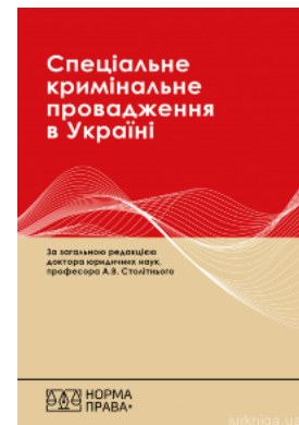
Спеціальне кримінальне провадження в Україні: науково-практичний посібник. Видання друге

Перейти до галузі права Міжнародний арбітраж