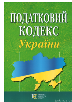
Податковий кодекс України. Алерта