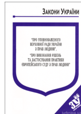
Закони України "Про уповноваженого Верховної Ради України з прав людини", "Про виконання рішень та застосування практики..."