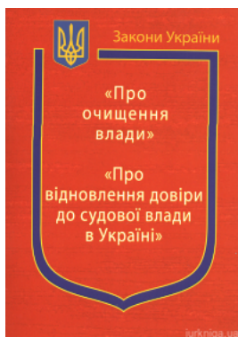
Закони України: "Про очищення влади", "Про відновлення довіри до судової влади в Україні"