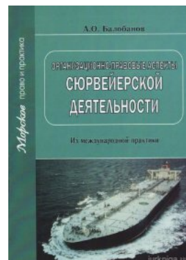
Організаційно-правові аспекти сюрвейерської діяльності