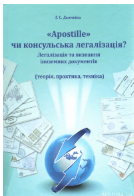
Apostille чи консульська легалізація? Легалізація та визнання іноземних документів (теорія, практика, техніка)