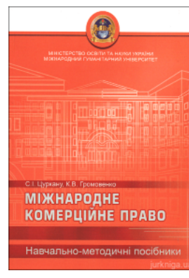
Міжнародне комерційне право. Навчально-методичний посібник