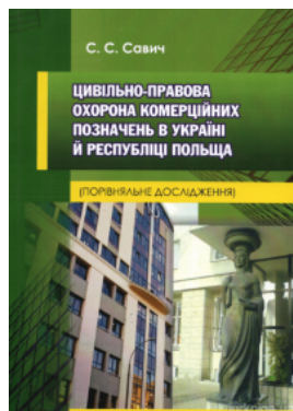
Цивільно-правова охорона комерційних позначень в Україні й Республіці Польща