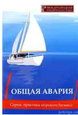
Общая авария: міжнародні та національні стандарти