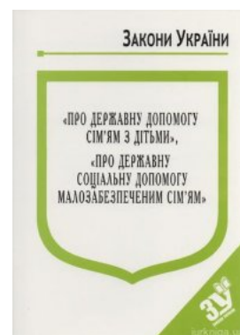
Закони України "Про державну допомогу сім'ям з дітьми", Про державну соціальну допомогу малозабезпеченим сім'ям"