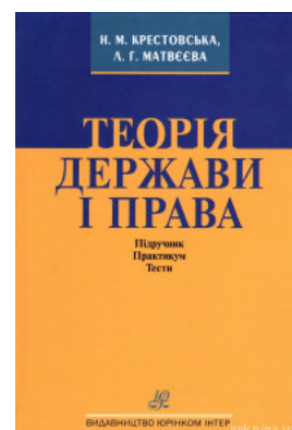
Теорія держави і права. Підручник. Практикум. Тести