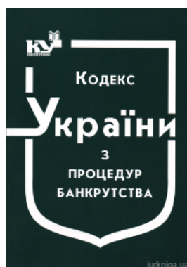
Кодекс України з процедур банкрутства