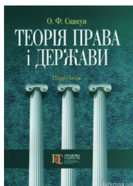
Теорія права і держави. Підручник, 4-те видання