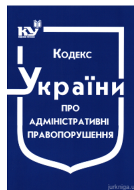
Кодекс України про адміністративні правопорушення

Перейти до галузі права Теорія держави і права