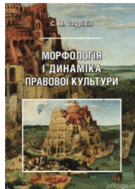
Морфологія і динаміка правової культури. Навчальний посібник