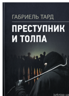
Преступник и толпа