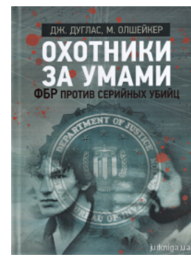
Охотники за умами. ФБР против серийных убийц

Перейти до галузі права Кримінальне право та процес