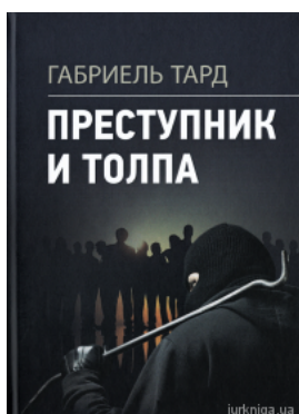
Преступник и толпа