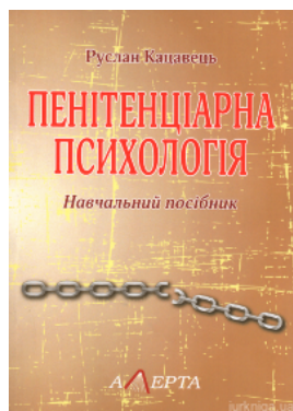
Пенітенціарна психологія. Навчальний посібник