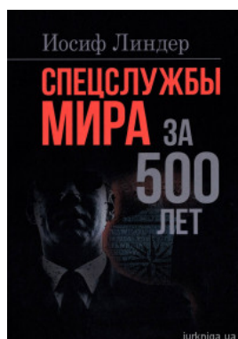
Спецслужбы мира за 500 лет