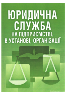
Юридична служба на підприємстві