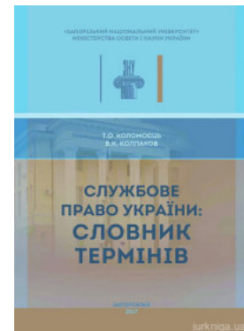
Службове право України: словник термінів