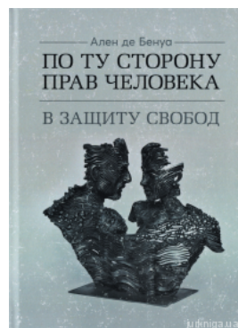
По ту сторону прав человека. В защиту свобод