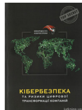
Кібербезпека та ризики цифрової трансформації компаній

Перейти до галузі права Адміністративне право