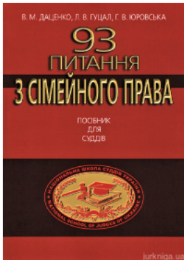
93 питання з сімейного права. Посібник для суддів