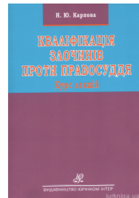
Кваліфікація злочинів проти правосуддя. Курс лекцій

Перейти до галузі права Кримінальне право та процес