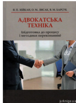
Адвокатська техніка (підготовка до процесу і методики переконання)