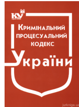
Кримінальний процесуальний кодекс України