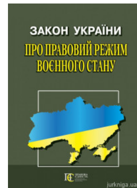
Закон України "Про правовий режим воєнного стану". Алерта