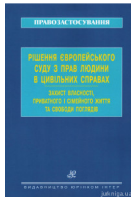
Рішення Європейського суду з прав людини в цивільних справах. Захист власності, приватного і сімейного життя та свободи поглядів