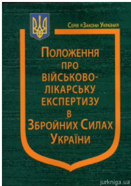
Положення про військово-лікарську експертизу в Збройних Силах України