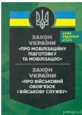
Закони України "Про мобілізаційну підготовку та мобілізацію", "Про військовий обов'язок і військову службу". ЦУЛ