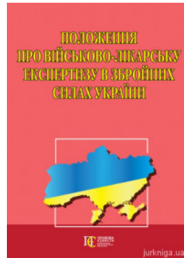
Положення про військово-лікарську експертизу в Збройних Силах України. Алерта