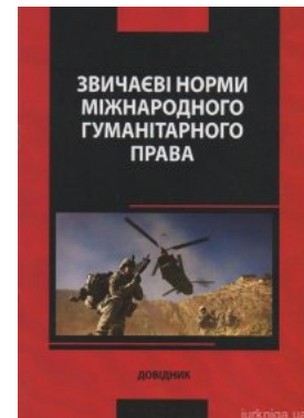
Звичаєві норми міжнародного гуманітарного права