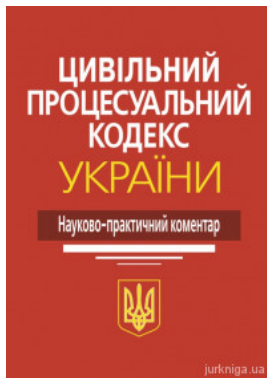
Цивільний процесуальний кодекс України: науково-практичний коментар