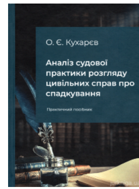
Аналіз судової практики розгляду цивільних справ про спадкування

Перейти до галузі права Цивільне право та процес