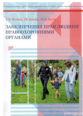
Забезпечення прав людини правоохоронними органами