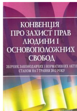
Конвенція про захист прав людини і основоположних свобод. ЦУЛ