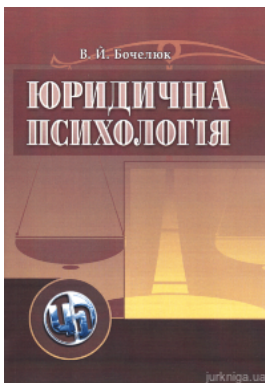
Юридична психологія. Навчальний посібник