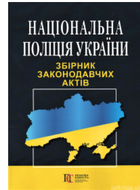
Національна поліція України. Збірник законодавчих актів. Алерта