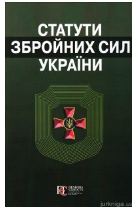
Статути Збройних сил України. Збірник законів. Алерта