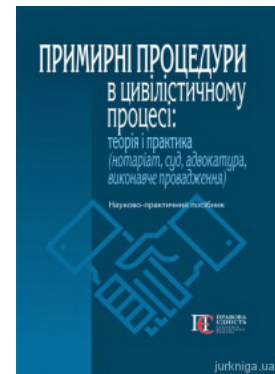
Примирні процедури в цивільному процесі: теорія і практика