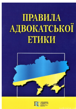
Правила адвокатської етики. Алерта