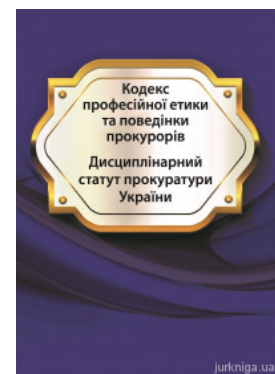
Кодекс професійної етики та поведінки прокурорів. Дисциплінарний статут прокуратури України

Перейти до галузі права Юридичний менеджмент