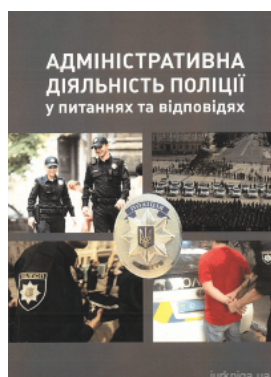
Адміністративна діяльність поліції у питаннях та відповідях