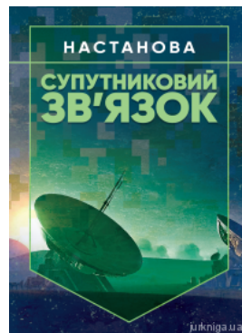
Супутниковий зв'язок. Настанова