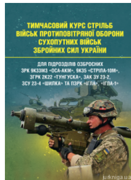
Тимчасовий курс стрільб військ протиповітряної оборони Сухопутних військ Збройних Сил України