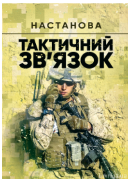
Тактичний зв'язок. Настанова