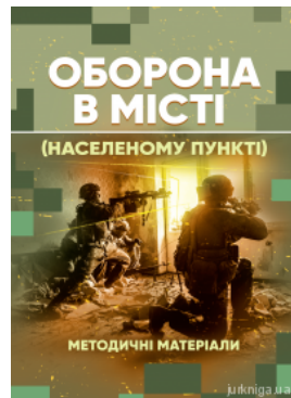
Оборона в місті (населеному пункті). Методичні матеріали