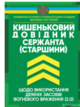
Кишеньковий довідник сержанта (старшини) щодо використання деяких засобів вогневого враження