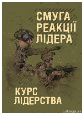
Смуга реакції лідера (курс лідерства)