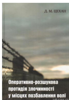
Оперативно-розшукова протидія злочинності у місцях позбавлення волі