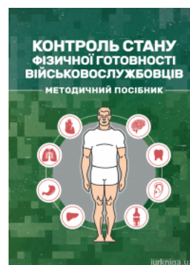
Контроль стану фізичної готовності військовослужбовців