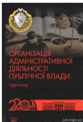
Організація адміністративної діяльності публічної влади