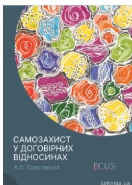
Самозахист у договірних відносинах