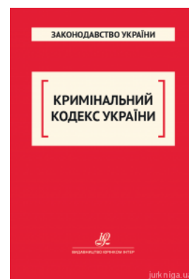
Кримінальний кодекс України. Юрінком Інтер

Перейти до галузі права Кримінальне право та процес