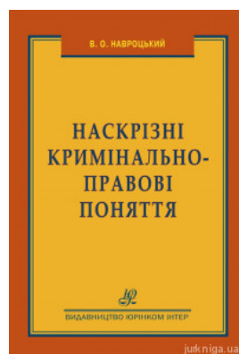
Наскрізні кримінально-правові поняття