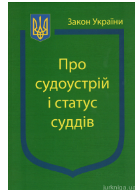
Закон України "Про судоустрій і статус суддів"