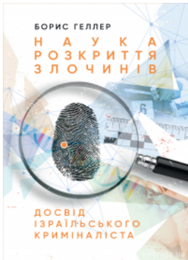
Наука розкриття злочинів: Досвід ізраїльського криміналіста