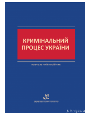
Кримінальний процес України. Навчальний посібник

Перейти до галузі права Кримінальне право та процес