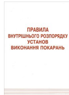
Правила внутрішнього розпорядку установ виконання покарань