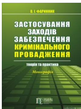
Застосування заходів забезпечення кримінального провадження: теорія та практика