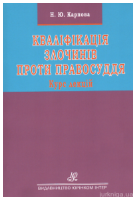
Кваліфікація злочинів проти правосуддя. Курс лекцій