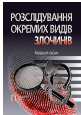
Розслідування окремих видів злочинів. Навчальний посібник