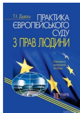
Практика Європейського суду з прав людини