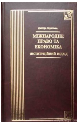
Міжнародне право та економіка. Інституційний підхід