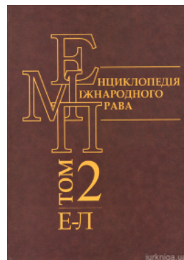
Енциклопедія міжнародного права. Том 2