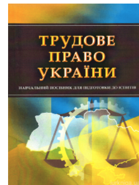
Трудове право України. Навчальний посібник для підготовки до іспитів