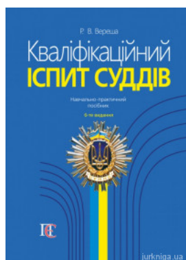
Кваліфікаційний іспит суддів: навчально-практичний посібник