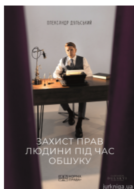
Захист прав людини під час обшуку