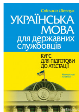
Українська мова для державних службовців: курс для підготовки до атестації. Видання друге