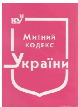
Митний кодекс України