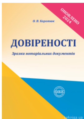
Довіреності: зразки нотаріальних документів