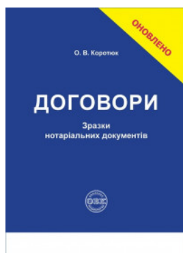
Договори: зразки нотаріальних документів