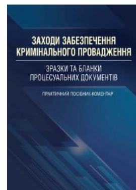
Заходи забезпечення кримінального провадження. Зразки та бланки процесуальних документів.

Перейти до галузі права Кримінальне право та процес