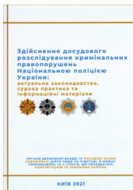
Здійснення досудового розслідування кримінальних правопорушень Національною поліцією України. Актуальне законодавство, судова практика та...