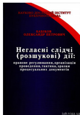
Негласні слідчі (розшукові) дії: правове регулювання, організація проведення, тактика, зразки процесуальних документів