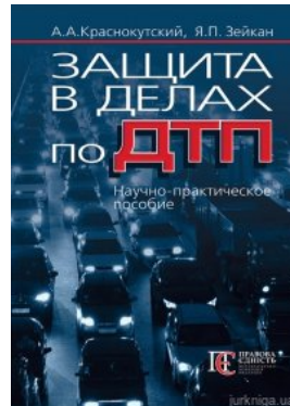
Защита в делах по ДТП Науч.-практ. пособ