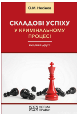
Складові успіху у кримінальному процесі. Видання друге