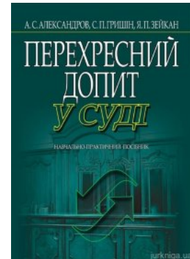
Перехресний допит у суді