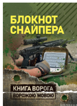
Блокнот снайпера. Книга ворога ворожою мовою