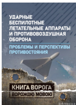
Ударные беспилотные летательные аппараты и противовоздушная оборона. Проблемы и перспективы противостояния. Книга ворога ворожою мовою