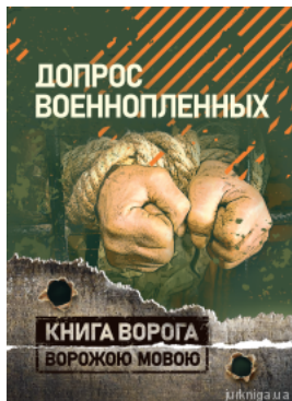
Допрос військовоплених. Книга ворога ворожою мовою