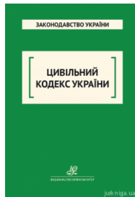
Цивільний кодекс України. Юрінком Інтер