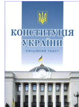
Конституція України: офіційний текст