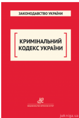
Кримінальний кодекс України. Юрінком Інтер