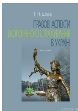
Правові аспекти екологічного страхування в Україні