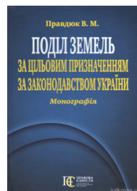
Поділ земель за цільовим призначенням за законодавством України