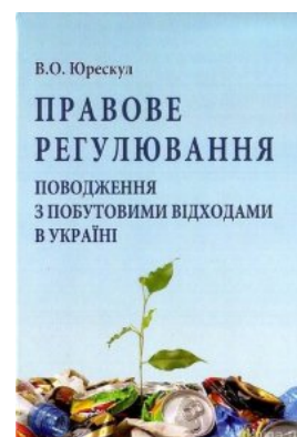
Правове регулювання поводження з побутовими відходами в Україні

Перейти до галузі права Адміністративне право