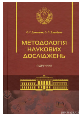
Методологія наукових досліджень