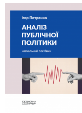
Аналіз публічної політики

Перейти до галузі права Міжнародне право