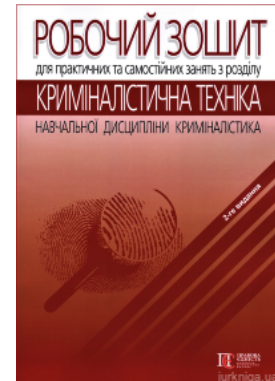
Робочий зошит для практичних та самостійних занять з розділу «Криміналістична техніка» навчальної дисципліни «Криміналістика»