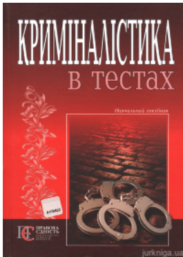
Криміналістика в тестах