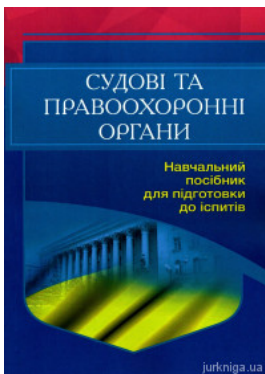
Судові та правоохоронні органи України. Навчальний посібник для підготовки до іспитів