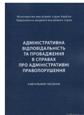
Адміністративна відповідальність та провадження в справах про адміністративні правопорушення

Перейти до галузі права Адміністративне право