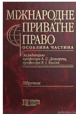
Міжнародне приватне право. Особлива частина