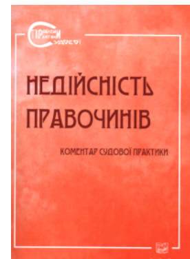
Недійсність правочинів. Коментар судової практики

Перейти до галузі права Цивільне право та процес