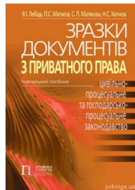
Зразки документів з приватного права (цивільне, сімейне, житлове, трудове, земельне, цивільно-процесуальне та госпо-дарсько--процесуальне...