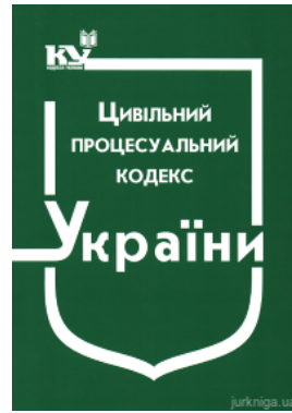
Цивільний процесуальний кодекс України