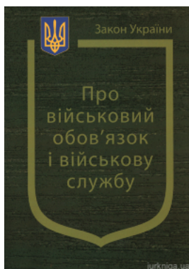
Закон України "Про військовий обов'язок і військову службу"