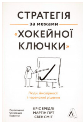
Стратегія за межами "хокейної ключки". Люди, ймовірності і переможні рішення