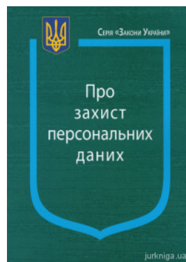
Закон України "Про захист персональних даних"