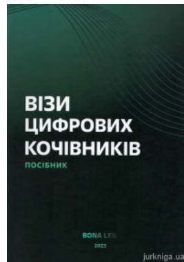
Візи цифрових кочівників