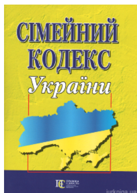
Сімейний кодекс України. Алерта