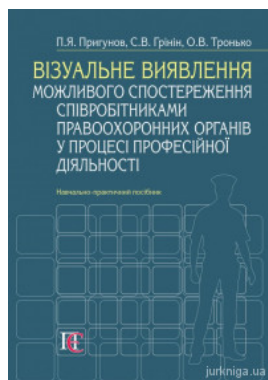
Візуальне виявлення можливого спостереження співробітниками правоохоронних органів у процесі професійної діяльності