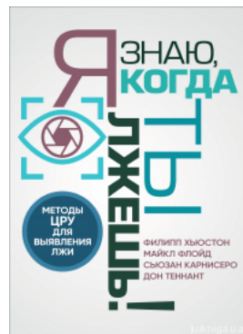
Я знаю, когда ты лжешь! Методы ЦРУ для выявления лжи