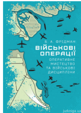
Військові операції: оперативне мистецтво та військові дисципліни