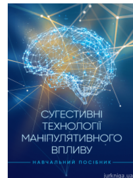
Суггестивні технології маніпулятивного впливу