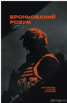
Броньований розум. Бойовий стрес та психологія екстремальних ситуацій