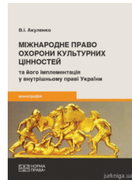
Міжнародне право охорони культурних цінностей та його імплементація у внутрішньому праві України