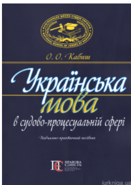
Українська мова в судово-процесуальній сфері. Навчально-практичний посібник. Видання друге