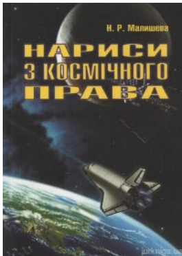
Нариси з космічного права