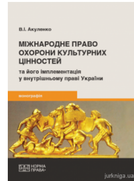
Міжнародне право охорони культурних цінностей та його імплементація у внутрішньому праві України