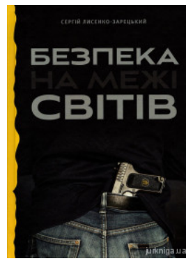
Безпека на межі світів