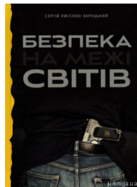
Безпека на межі світів