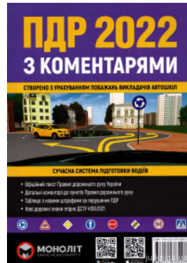
ПДР України 2022 з коментарями