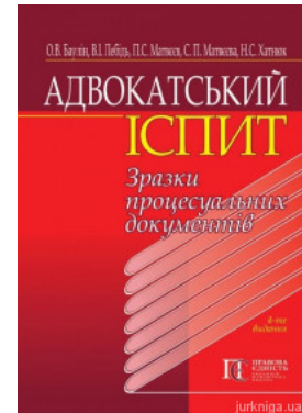
Адвокатський іспит: зразки процесуальних документів