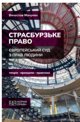
Страсбурзьке право. Європейський суд з прав людини. Теорія, принципи, практика