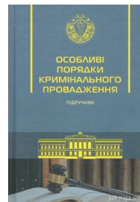
Особливі порядки кримінального провадження. Підручник

Перейти до галузі права Корпоративне право