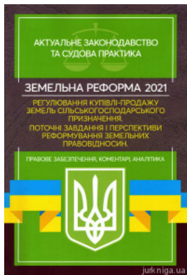
Земельна реформа 2021. Регулювання купівлі-продажу земель сільськогосподарського призначення. Поточні завдання і перспективи реформування земельних...