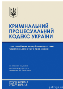
Кримінальний процесуальний кодекс України з постатейними матеріалами практики Європейського суду з прав людини