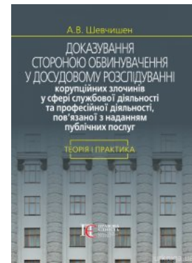
Доказування стороною обвинувачення у досудовому розслідуванні корупційних злочинів у сфері службової діяльності та професійної діяльності,...