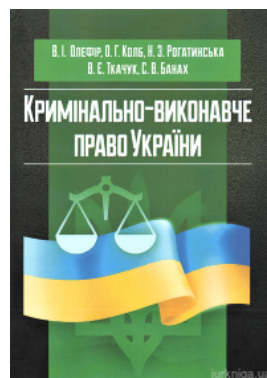
Кримінально-виконавче право України (у схемах та таблицях)