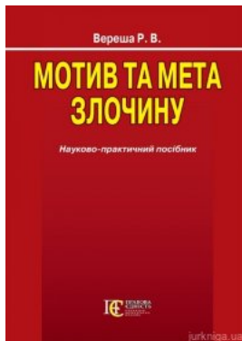
Мотив та мета злочину