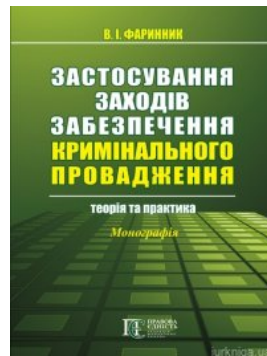
Застосування заходів забезпечення кримінального провадження: теорія та практика