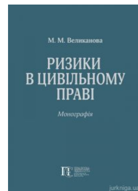
Ризики в цивільному праві

Перейти до галузі права Гражданское право и процесс