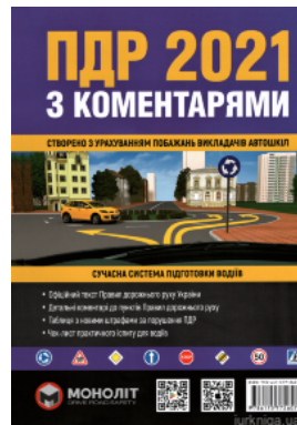
ПДР України 2021 з коментарями