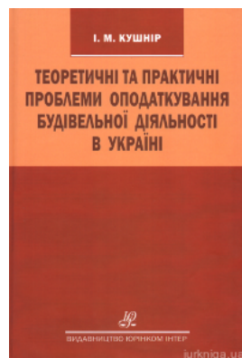
Теоретичні та практичні проблеми оподаткування будівельної діяльності в Україні