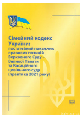
Сімейний кодекс України: постатейний покажчик правових позицій Верховного Суду - Великої Палати та Касаційного цивільного суду (практика 2021 року)