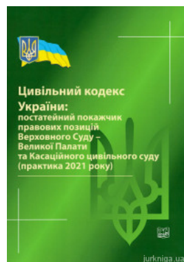
Цивільний кодекс України: постатейний покажчик правових позицій Верховного Суду - Великої Палати та Касаційного цивільного суду (практика 2021 року)