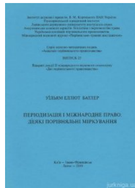
Періодизація і міжнародне право: деякі порівняльні міркування