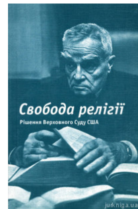
Свобода релігії. Рішення Верховного Суду США

Перейти до галузі права Порівняльне правознавство