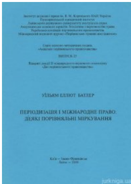
Періодизація і міжнародне право: деякі порівняльні міркування