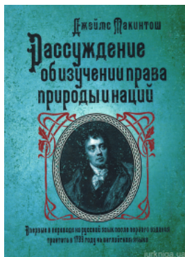
Рассуждение об изучении права природы и наций. И.И. Дахно