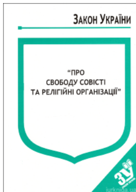
Закон України "Про свободу совісті та релігійні організації"