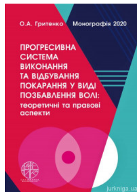
Прогресивна система виконання та відбування покарання у виді позбавлення волі: теоретичні та правові аспекти