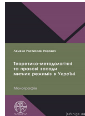
Теоретико-методологічні та правові засади митних режимів в Україні

Перейти до галузі права Конституційне право