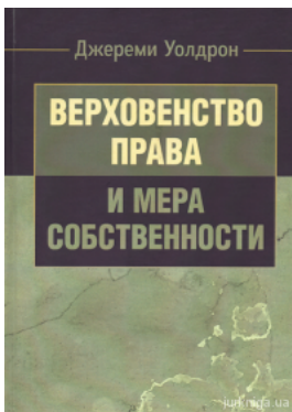
Верховенство права и мера собственности