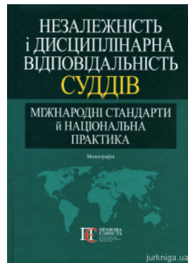
Незалежність і дисциплінарна відповідальність суддів: міжнародні стандарти й національна практика