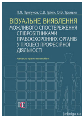
Візуальне виявлення можливого спостереження співробітниками правоохоронних органів у процесі професійної діяльності