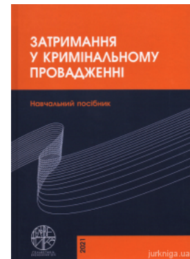
Затримання у кримінальному провадженні. Навчальний посібник