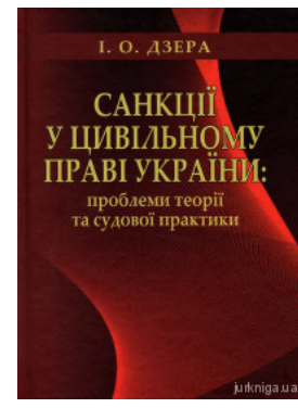
Санкції у цивільному праві України: проблеми теорії та судової практики

Перейти до галузі права Кримінальне право та процес